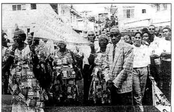
Les «Lilas» de Sainte-Luce.