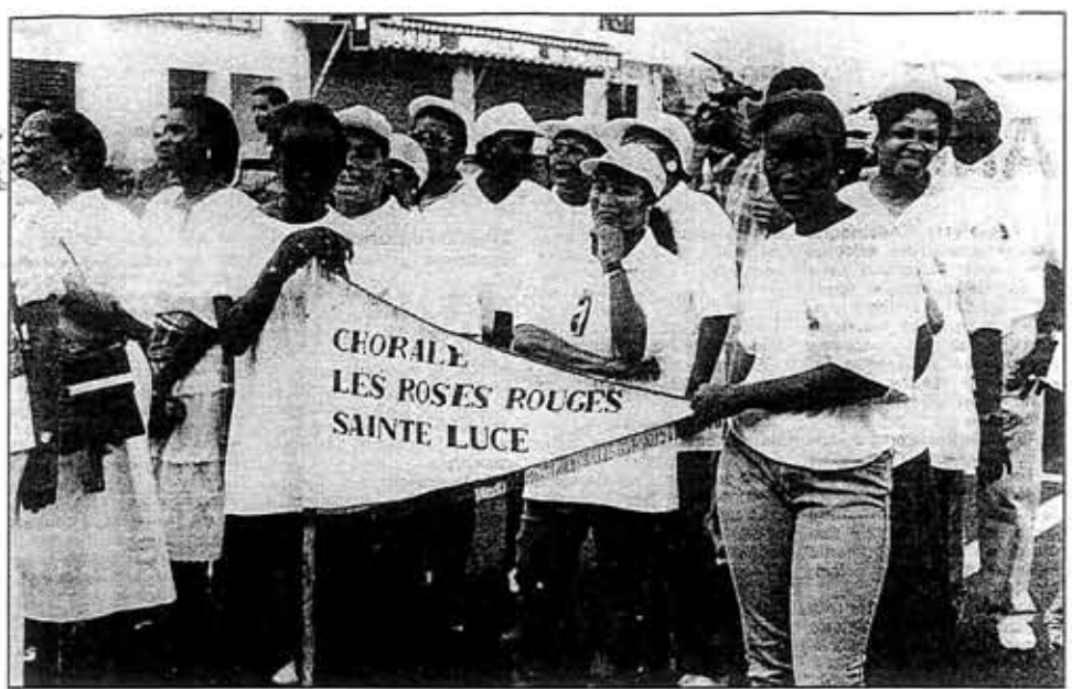
La chorale «Les roses rouges».