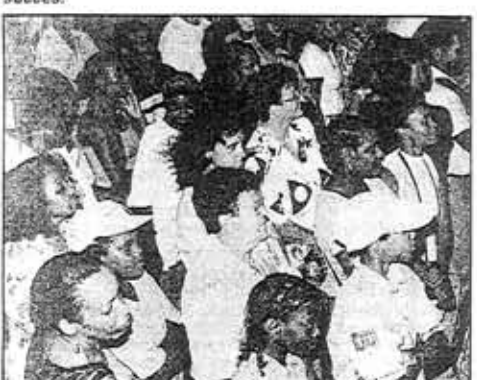
Beaucoup de monde pour la fête.