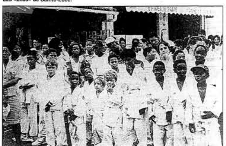
Les judokas ont pris part au défilé.