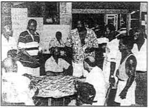
Les tournois de belote et de dominos ont obtenu un vil succès.